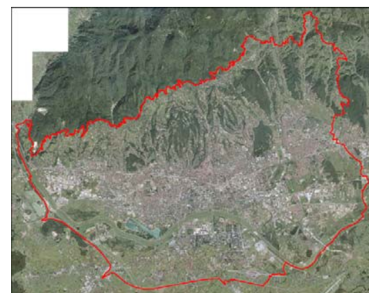
Granica obuhvata Generalnog urbanističkog plana grada Zagreba

Obuhvat Izmjena i dopuna istovjetan je obuhvatu Generalnoga urbanističkog plana kakav je utvrđen Prostornim planom Grada Zagreba, a obuhvaća njegovo uže gradsko područje između Parka prirode Medvednica i zagrebačke obilaznice, oko 220 km 2 .